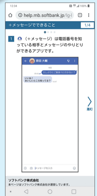
+メッセージの利用方法