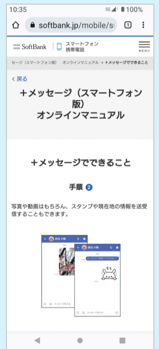
+メッセージの利用方法